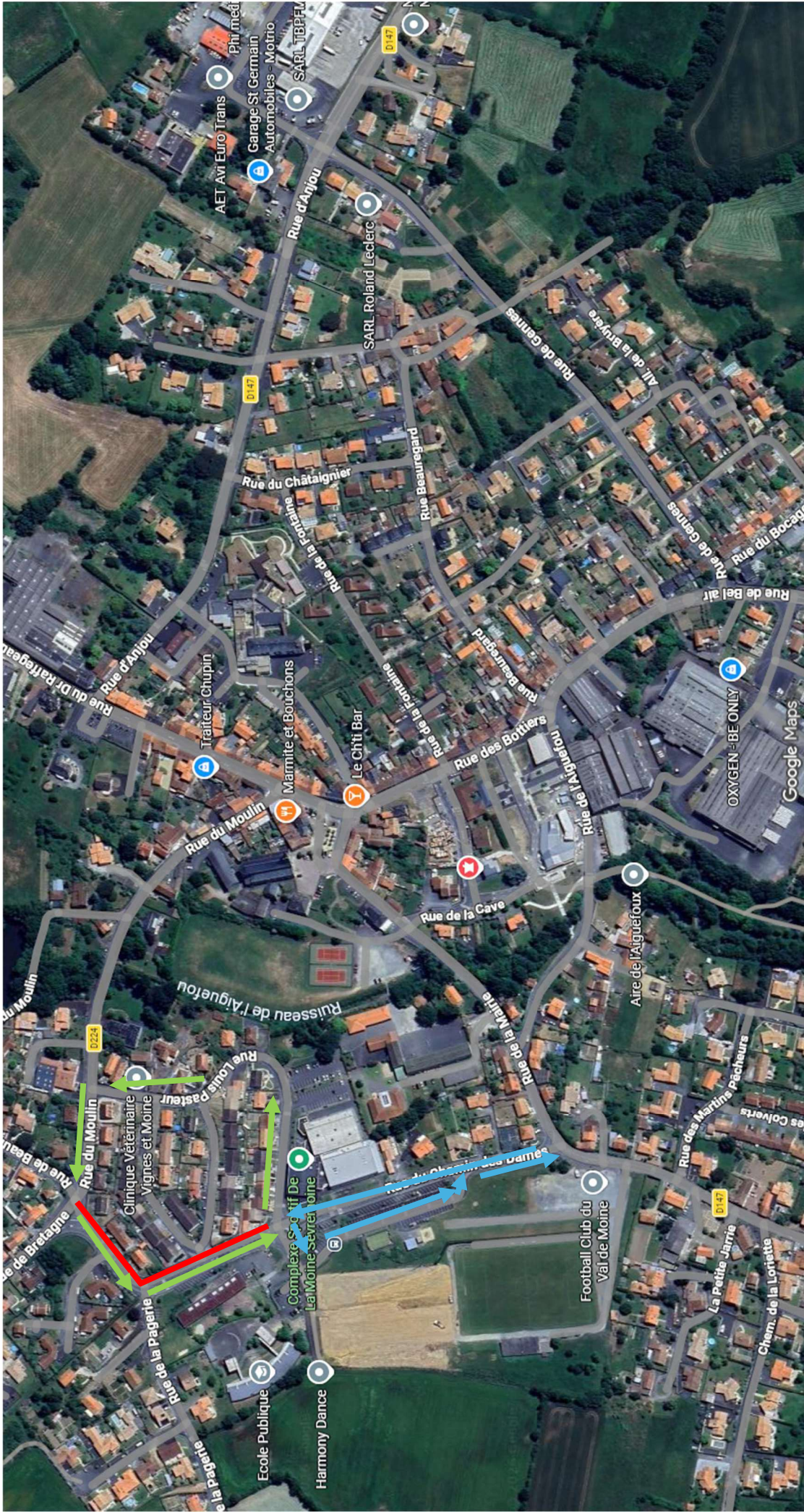
Seconde phase des travaux le 15/04/2026