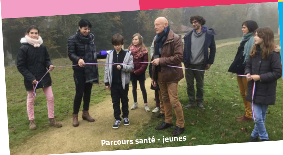
Parcours santé - jeunes