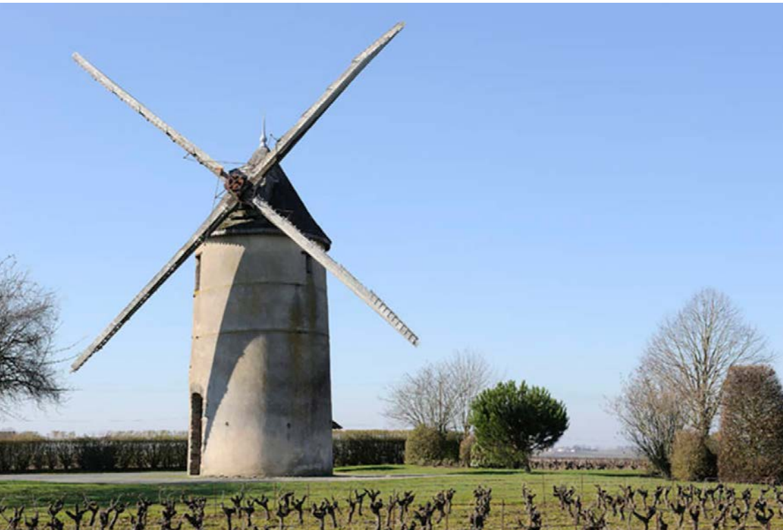
← Le moulin Guillou